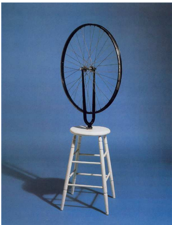
Fig. 3. Roda de bicicleta , de Marcel Duchamp, 1964 (reprodução do original de 1913).

Não somente os conceitos, mas também as criações de Duchamp eram paradoxais, talvez por sua mente estar em constante mudança, lidando sempre com as novas informações da época. Por exemplo, em 1913, quando fixou uma roda de bicicleta no assento de um