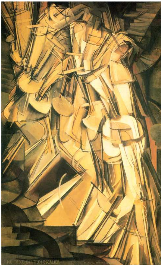
Fig. 1. Nu descendo uma escada n.º 2 , de Marcel Duchamp, 1912.

Em relação à arte feita de ideias, o biógrafo mais importante de Duchamp, Calvin Tomkins, diz que o artista queria recolocar a pintura a serviço da mente, já que desde os tempos de Courbet ela visava primordialmente à satisfação dos olhos*. Para o autor, a